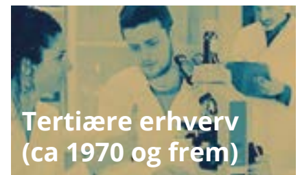
Tertiære erhverv (ca. 1970 og frem)

Markedsøkonomi med handel og pengeøkonomi præger den kraftige stigning i produktionen.