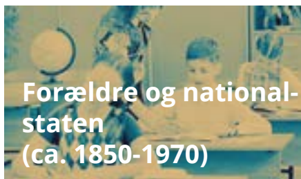
Forældre og national- staten (ca. 1850-1970)

Da individet er styret af traditioner og fællesskaber som familien/slægten og lokalsamfundet, lever den enkelte ikke et individualiseret liv.