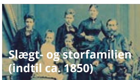
Slægt- og storfamilien (indtil ca. 1850)

I det traditionelle samfund spiller den primære socialisation i familien den væsentligste rolle. Gradvist forøges betydningen af den sekundære socialisation - og i det senmoderne samfund taler man således om en dobbeltsocialisation, idet individet nu lever sit liv i mange skiftende sociale arenaer.