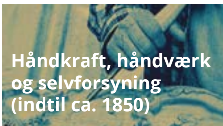
Håndkraft, håndværk og selvforsyning (indtil ca. 1850)

I det traditionelle (mangel-)samfund er familiemedlemmerne afhængige af hinanden i nødvendige arbejdsfællesskaber. Børnene bruges også som arbejdskraft. Familierne bliver gradvist tømte for tidligere nødvendige funktioner. Ligestilling, individualisering og globalisering åbner op for flere forskellige familietyper, der mere bygger på følelser og lyst.