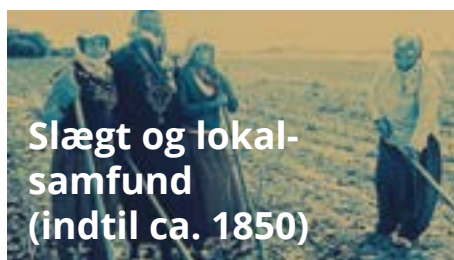
Slægt og lokal- samfund (indtil ca. 1850)

I takt med at samfundet aftraditionaliseres og individualiseres, bliver den enkelte mere og mere ansvarlig for egne valg. Friheden er stor, men det stiller også krav til selvværd og selvtillid at administrere de mange valgmuligheder.