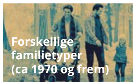
Forskellige familietyper (ca 1970 og frem)

Men en økonomisk velstandsstigning og en begyndende aftraditionalisering medfører en stadig stigende kulturel og social ligestilling. Skilsmisser forekommer således i stigende omfang.