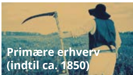
Primære erhverv (indtil ca. 1850)

Specielt udviklingen i transportteknologi og kommunikationsteknologi er væsentlig i overgangen fra det traditionelle til det senmoderne samfund. Internettet har gjort os uafhængige af tid og sted. Vi kan gå online når som helst og hvor som helst. Afstande betyder mindre.