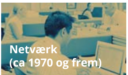
Netværk (ca. 1970 og frem)

Landbruget oplever en stigende mekanisering, og den overskydende arbejdskraft søger til byen og bliver nu typisk ansat på fabrikker.