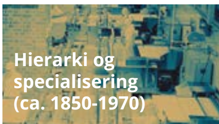
Hierarki og specialisering (ca. 1850-1970)

Den enkelte bondefamilie er i høj grad selvforsynende.